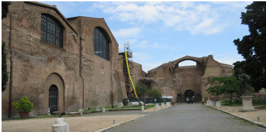
駅前にあるローマの古代遺跡ディオクレティアヌスの浴場跡

テルミニ駅は大きな駅で郵便局やレストラン、喫茶や土産物などなんでも揃っていて、ホテルを抜け出し昼となく夜となくしばしば通った。テルミニの名前は、近くに古代ローマ時代の遺跡ディオクレティアヌスの浴場（＝テルメ）があることに由来するといわれている。