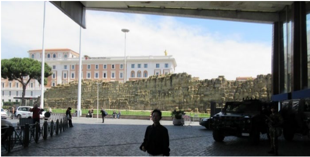
古代ローマ時代の城壁

テルミニ駅はムッソリーニの意向で今見る駅舎に建て替えられた。外見は近代的な駅舎であるが駅舎には古代ローマの城壁が組み込まれているなどイタリアらしい雰囲気を持った駅である。