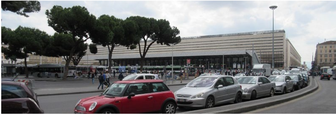
ローマ終着駅・テルミニ

初めてローマを訪れたのは1978年、今から44年も前のことである。公務でローマに滞在するときの定宿は終着駅テルミニのすぐ近くにあるマッシモ・ダゼリオホテルであった。