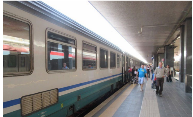
テルミニ駅の長いホーム